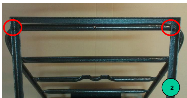
Obr. 2: Otvory na připevnění nástavby na přepravky v horní opěrné části korby Mokaře

Nástavbu přiložíme na korbu Mokaře. Přes otvory v rámu vinařské nástavby narýsujeme polohu 6 otvorů. Polohy zvýrazníme důlčičkem. Otvory vyvrtáme vrtákem o průměru 5,5 mm a odjehlíme. Nástavbu s Mokařem spojíme šrouby a zajistíme podložkou a maticí.