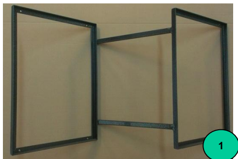
Obr. 1: Nástavba na přepravky – dodávaný komplet

Nástavbu přiložíme na korbu Mokaře. Přes otvory v rámu vinařské nástavby narýsujeme polohu 6 otvorů. Polohy zvýrazníme důlčičkem. Otvory vyvrtáme vrtákem o průměru 5,5 mm a odjehlíme. Nástavbu s Mokařem spojíme šrouby a zajistíme podložkou a maticí.