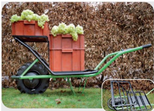
Nástavba na přepravky – celý komplet

Přepravky se vsadí do konstrukce a při transportu nehrozí jejich sklouznutí z nástavby Mokaře.