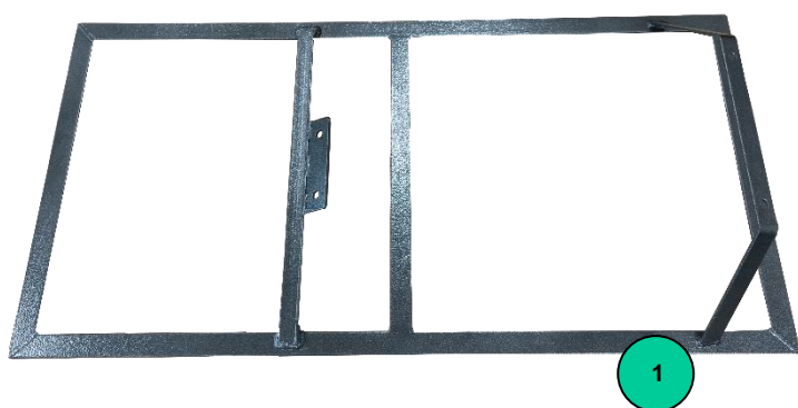
Obr. 1: Nástavba pro včelaře – dodávaný komplet