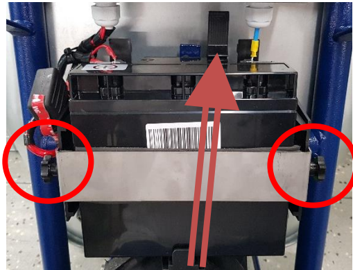
obr. 7. - odpojení akumulátoru z držáku uvolnění šroubů a držáku aku.

Poté uvolněte dva boční šrouby a odejměte držák akumulátoru, znázorněné na obr. č. 7. (Ke stlačení západky u starších typů držáků lze použít např. šroubovák.) Poté akumulátor vysuňte z držáku.