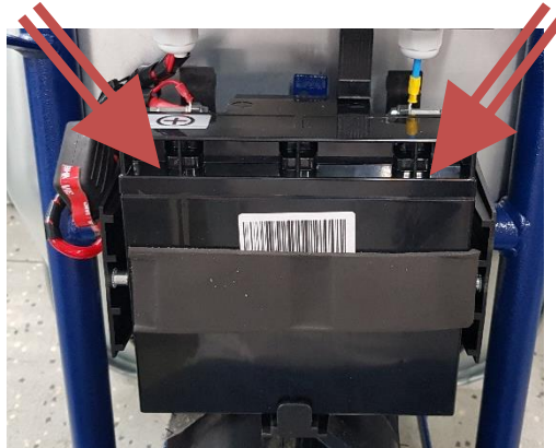
obr. č. 8. - označení místa, kde se odšroubuje akumulátor od vodičů

Akumulátor není nutné na zimu vyjímat a přenášet do tepla, ale je nutné jej dobře nabít a 1x za měsíc i při nečinnosti dobíjet. Při běžném nabíjení zůstává akumulátor v Motúčku! Zbytečně jej nevyjímejte!