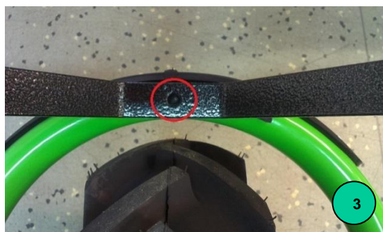
Obr. 3: Otvor na připevnění nástavby pro včelaře na rám Motúčka v přední části rámu u pojezdového kola.