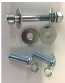
Šrouby pro připevnění nástavby na rám Motúčka