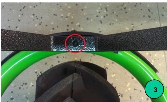
Abb. 3: Loch zur Befestigung des Imkeraufbaus auf dem Rahmen von Motokarre im vorderen Teil des Rahmens am Laufrad.