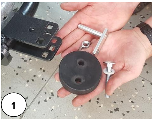
Abb. 3 Stellen Sie die Richtung der Schar ein, indem Sie das Loch des Universalträgerhalters auswählen.

Abb. 1–2 In die Halterung des Universalträgers den Schneepflug platzieren ( a ) ihn mit Stiftverbindung, Schraube, zwei Unterlegscheiben und Flügelmutter befestigen, die im Zubehör des Universalträgers enthalten sind.