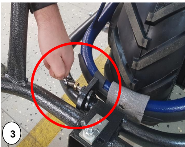
Abb. 4-5 Die so abgesenkte Gabel unter die Last schieben oder die Last auf die Gabel legen. Durch Anheben von Motokarre in einer kippgleichen Bewegung in Höhe bis zum charakteristischen Klicken der Verriegelung das Schloss in der Transportposition sichern. Durch Drücken der Handgriffe nach unten wird die Last in die Transportposition angehoben.